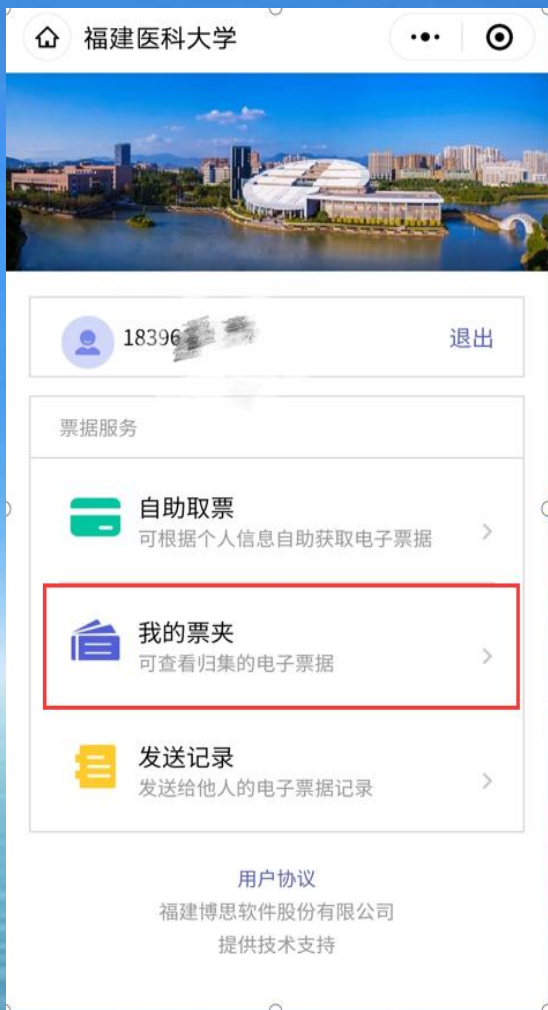
查看个人所有票据