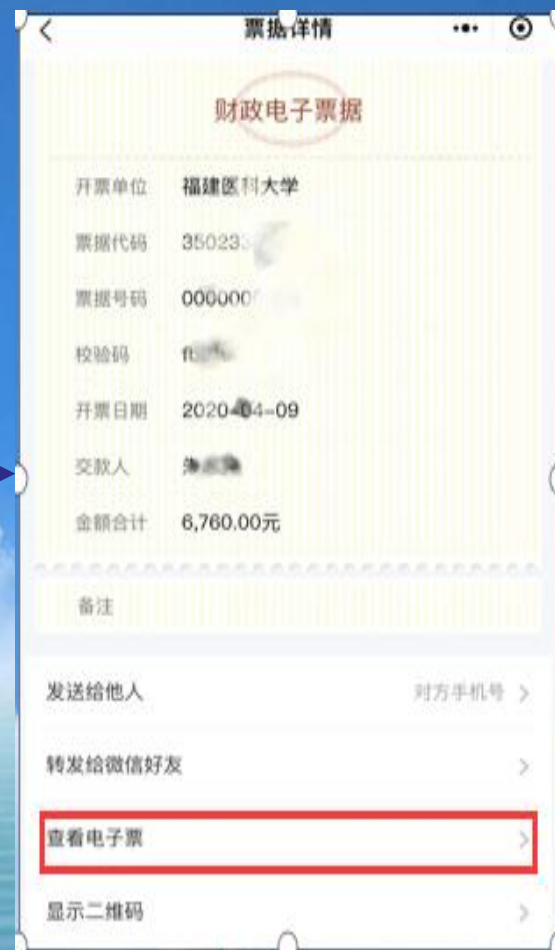
查看电子票据信息