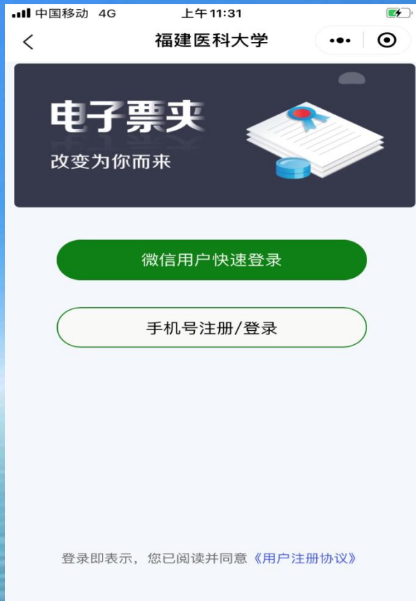
微信授权快速登录或手机号注册登录