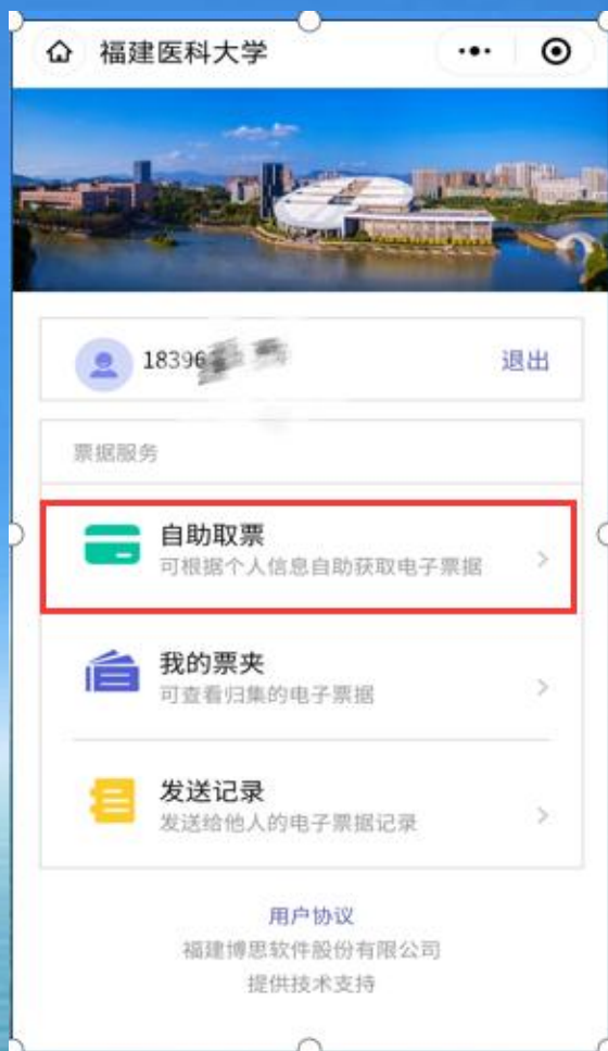
首次使用选择自助取票