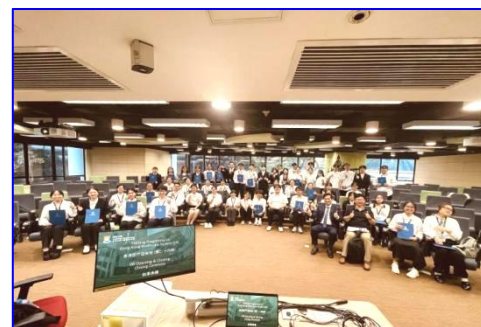
颁发证书 结业合影